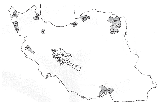
مراکز آموزشی دانشگاه آزاد ایران که در سال ۵۹-۱۳۵۸ دانشجویی پذیرفتند.

علاوه بر آن، برنامه‌ریزی‌های اولیه برای انتقال مرکز اصلی دانشگاه آزاد ایران از تهران به بهشهر مازندران، شامل احداث ساختمان‌های اداری و آموزشی، اقامتگاه‌ها برای استادان و کارکنان و مراکز تفریحی و تجاری نیز صورت گرفته بود (Free University of Iran, 1979a).